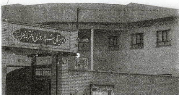
ساخت سالن ورزشی مدرسه میثم در محله دانشسرا